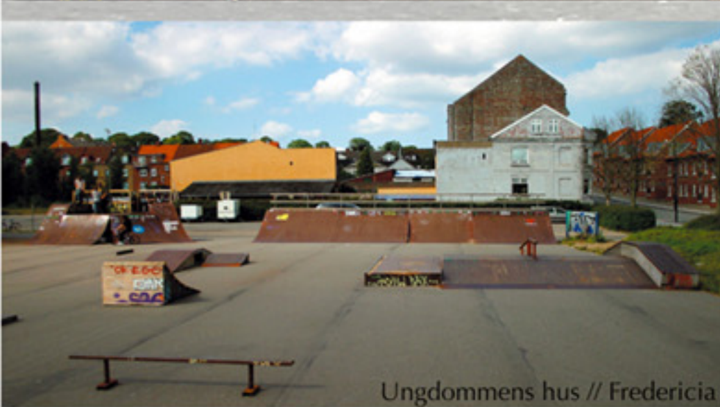
Ungdommens hus // Fredericia